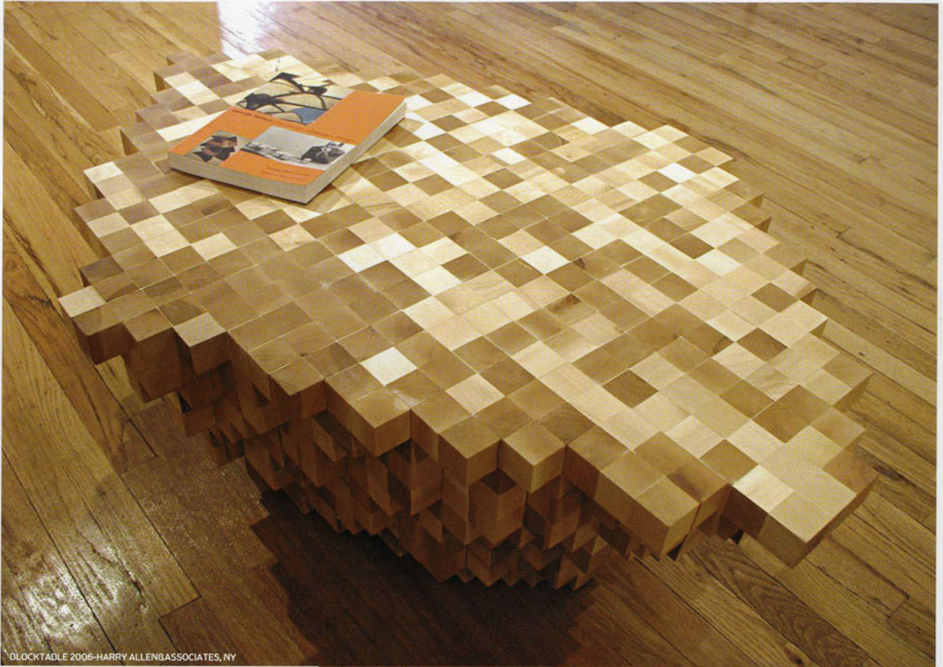
BLOCKTABLE 2006-HARRY ALLEN&ASSOCIATES, NY

Bizi gerçekleştirdiğiniz birkaç işte ve bu işleri gerçekleştiren geçirdiğiniz süreçte sözlü olarak gezdirebilir misiniz?